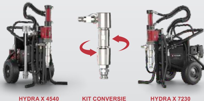
HYDRA X 4540